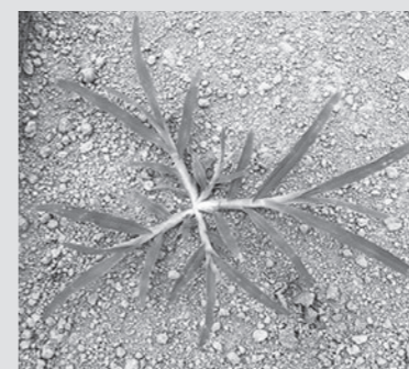
生育中期のオヒシバ

昨今で最も問題になりやすい雑草です。主な発芽期間は5〜7月で、7〜9月頃に花をつけ種を落とします。田畑や樹園地等場所を選ばずに生育し、過度に踏み固められた土でも根を張る特徴があります。 生育の進んだオヒシバでは、除草剤の効果が著しく低下し、薬剤での防除が困難になります。また、