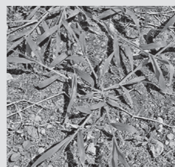
生育期のメヒシバ

ラウンドアップへの抵抗性を持った個体がほとんどを占めているため、薬剤防除の際は注意が必要です。 主な防除方法としては、出芽直後に芽かきや表土を浅く削ること、簡単に防除することが出来ます。また、葉の枚数が3〜5枚の生育初期であれば、イネ科用除草剤も効果的に作用する為、初期での対策が重要になります。