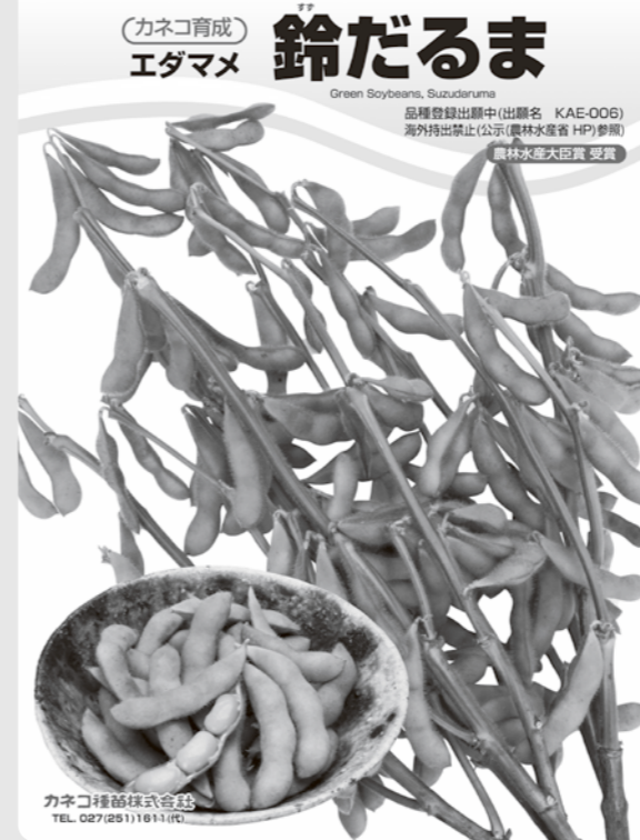
カネコ種苗株式会社 TEL. 027(25)116110